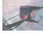
SILLA METALICA 34CM X 34CM X 85CM COLOR NEGRO