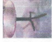
MESA REDONDA DIAMETRO 60CM ALTO 75CM