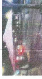
QUITASOL 254CM ALTO 200CM ANCHO