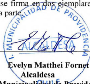
Evelyn Matthei Fornet Alcaldesa

Unión Comunal Juntas Vecinos de Providencia