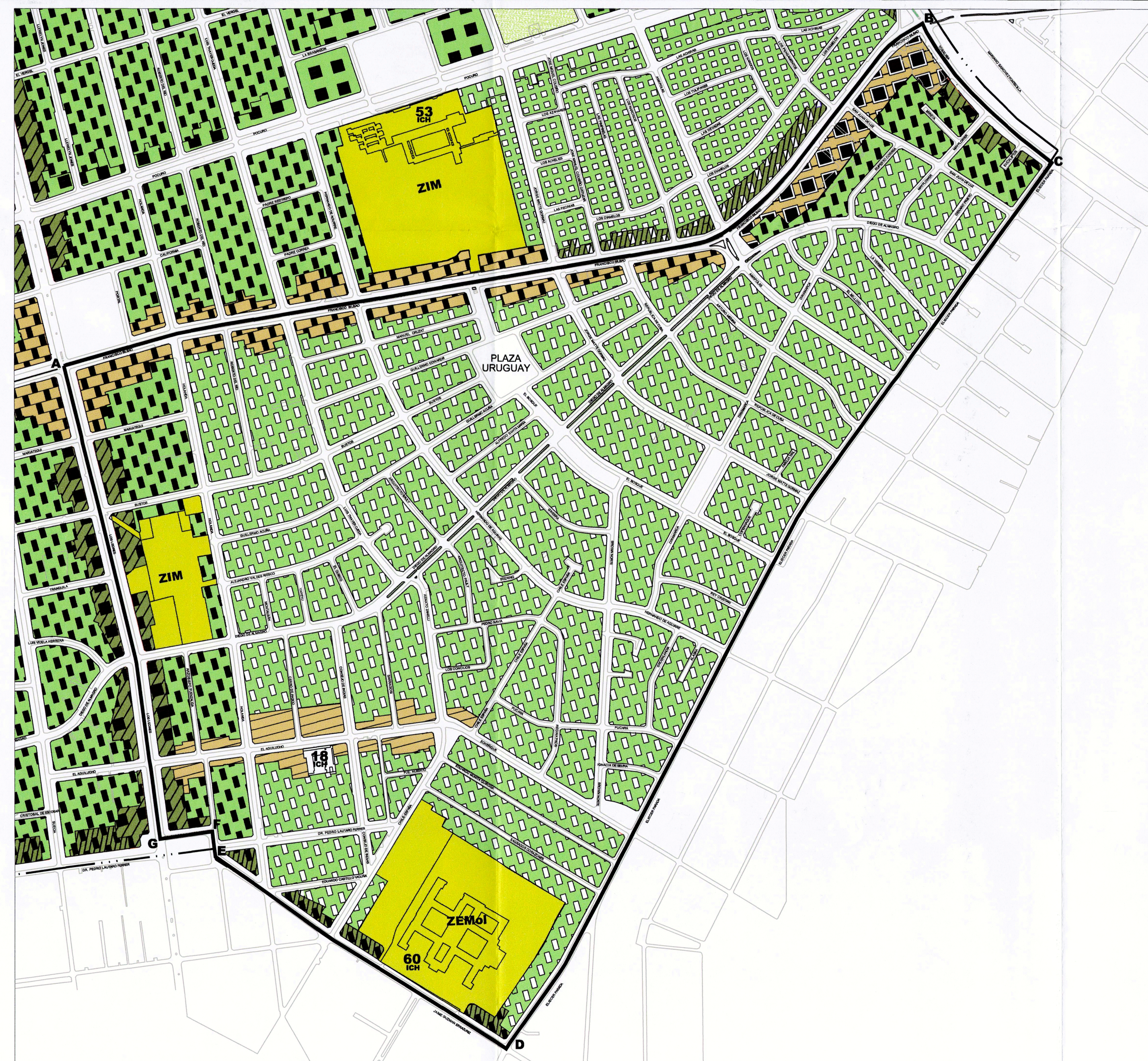
SITUACION ANTERIOR PLAN REGULADOR PRCP 2007 PLANO DE EDIFICACION BARRIO DIEGO DE ALMAGRO (ALMAGRO NORTE - PLAZA URUGUAY) ESCALA 1:5.000