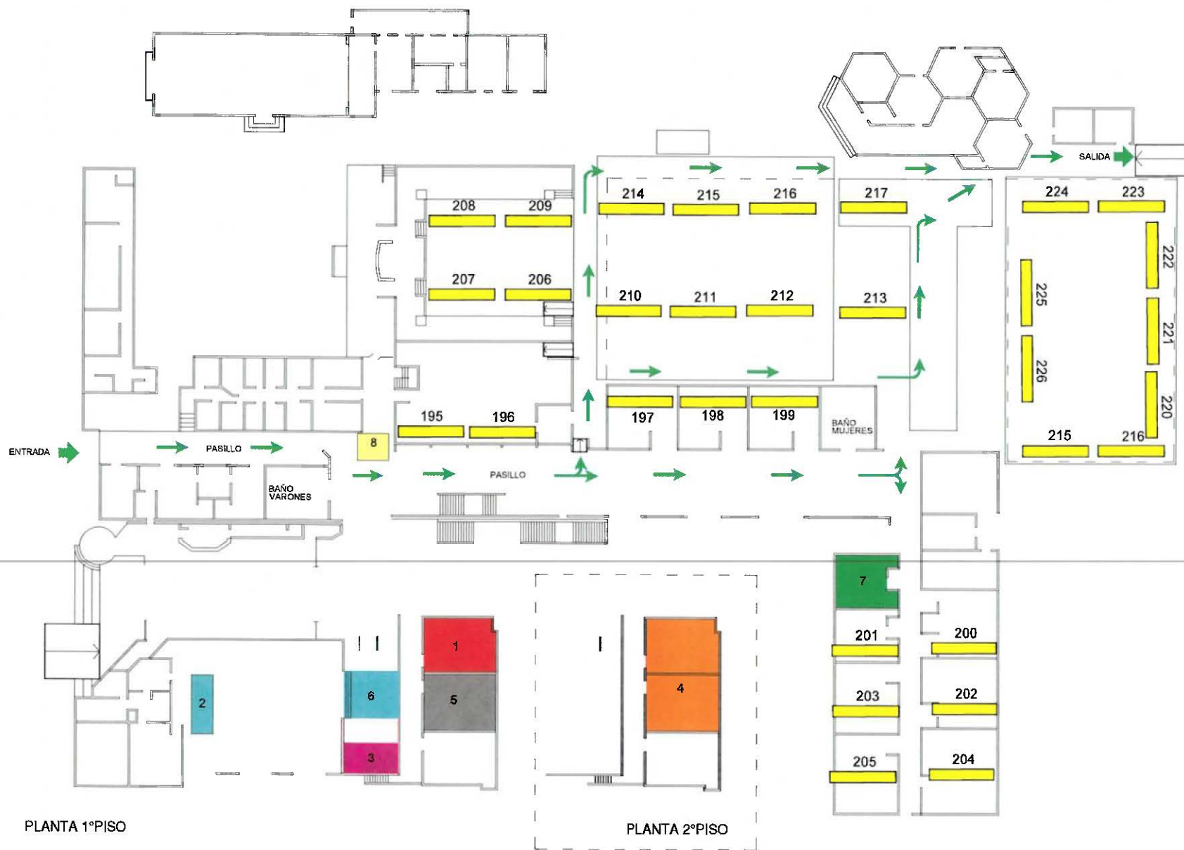
PLANTA 1º PISO