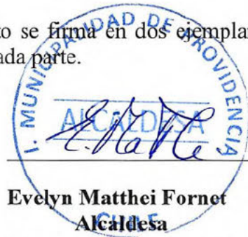
Evelyn Matthei Fornet Alcaldesa