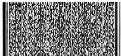
Timbre Electrónico SII

Res.86 de 2005 Verifique documento: www.sii.cl