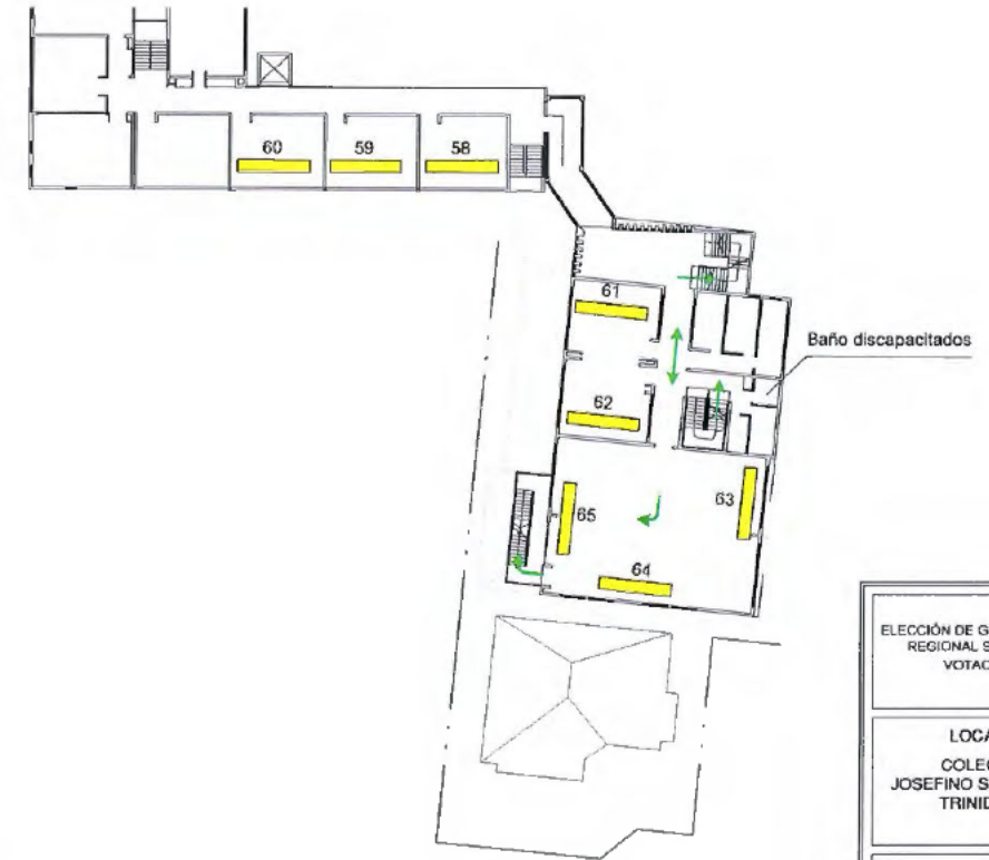
PLANTA SEGUNDO PISO

ELECCIÓN DE GOBERNADOR REGIONAL SEGUNDA VOTACIÓN