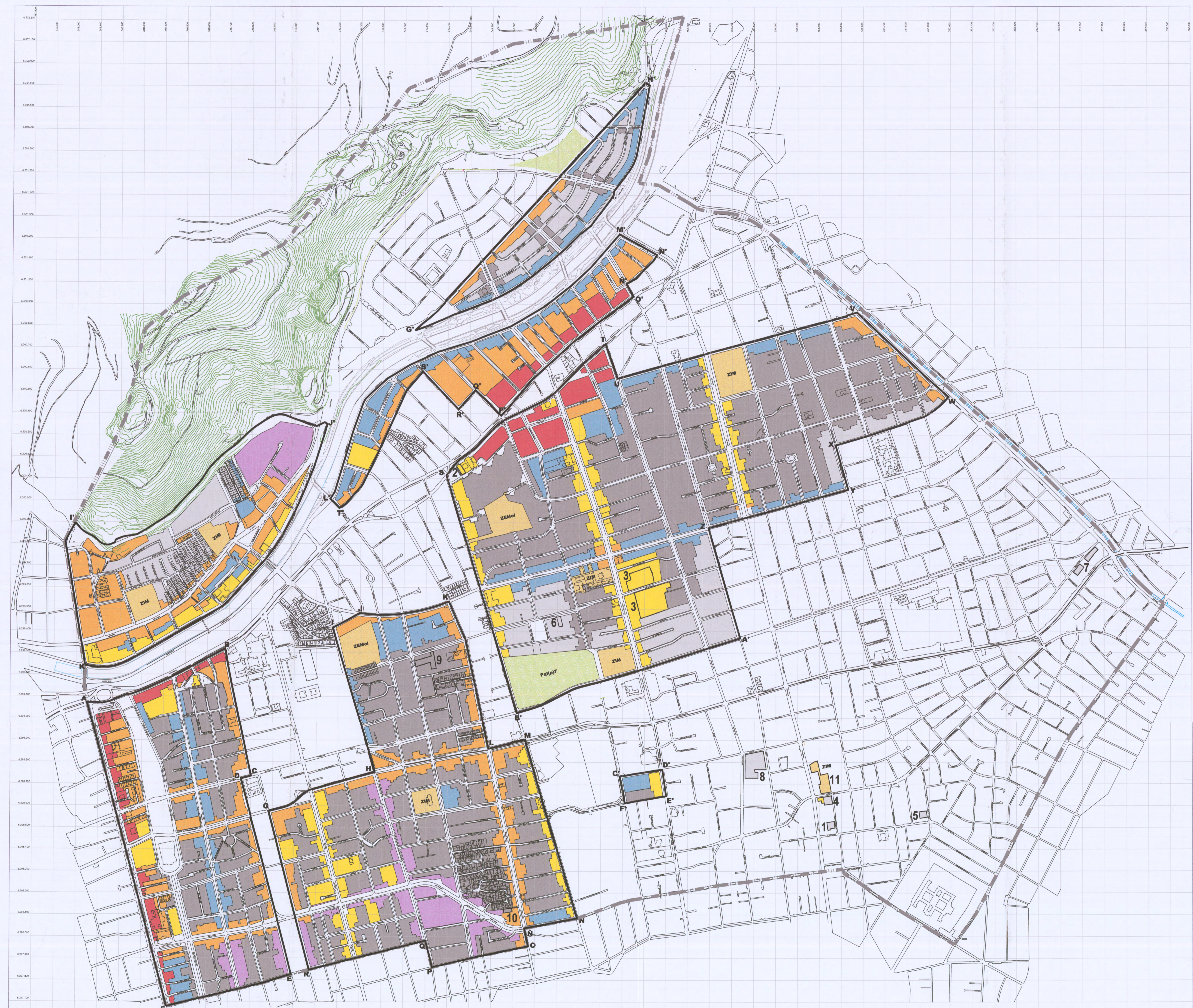
SITUACIÓN ANTERIOR PLAN REGULADOR PRCP 2007 PLANO ESPACIO PRIVADO: ZONAS DE USOS DE SUELO