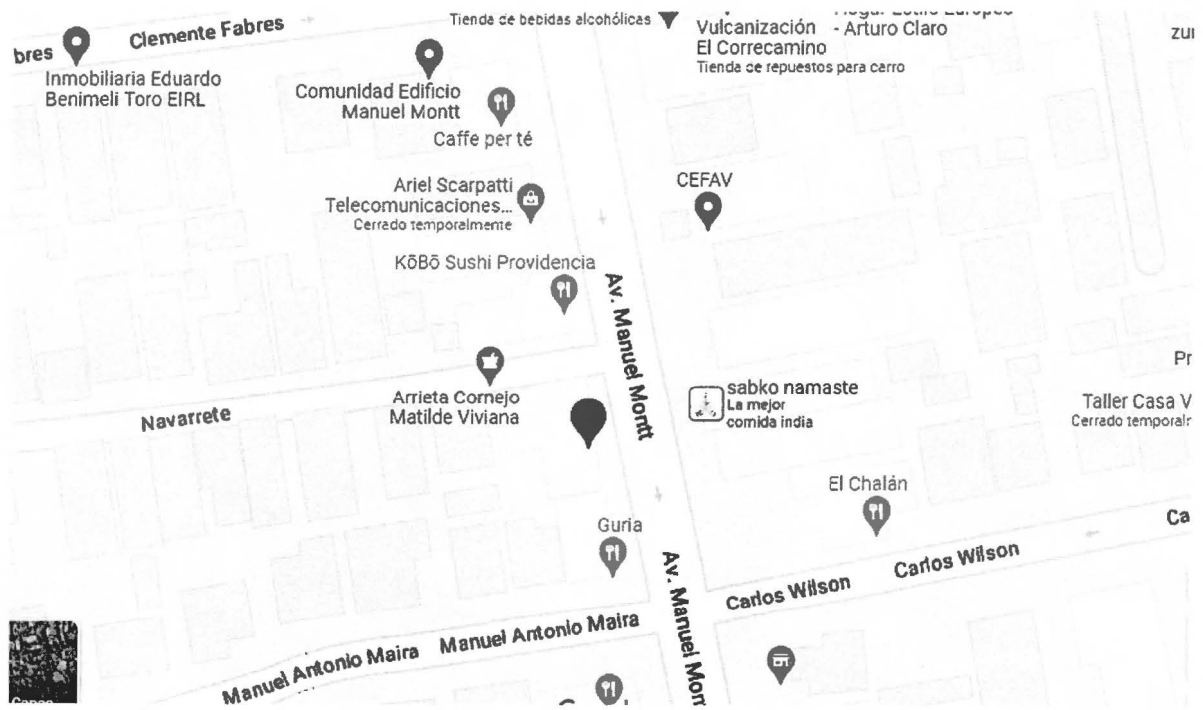
Figura 1: Ubicación edificio de Manuel Montt 1587.

El inmueble está ubicado en Avenida Manuel Montt 1587, comuna Providencia. Siendo las calles principales, Navarrete al norte, Manuel Antonio Maira al sur, Miguel Claro al poniente y Antonio Varas al oriente. En la imagen 01 se entrega la ubicación en mapa.