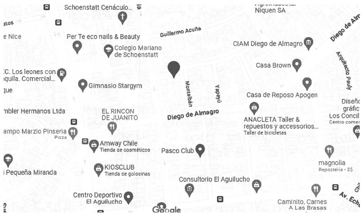
Figura 1: Ubicación del edificio de calle Alejandro Valdés N° 2517. Ref.: Google Maps.

El inmueble está ubicado en calle Alejandro Valdés N° 2517, comuna Providencia. Siendo las calles principales, Guillermo Acuña al norte, Diego de Almagro al sur, Holanda al poniente y Montalbán al oriente. En la imagen 01 se entrega la ubicación en mapa.