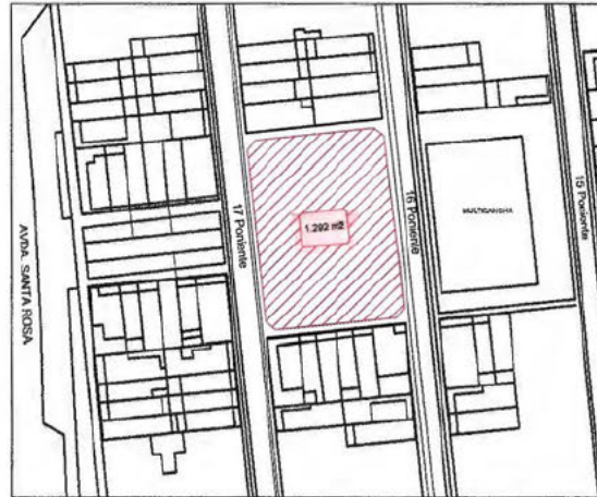
PLANO DE UBICACIÓN