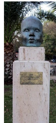
Ilustración 34 Tami

(Lugar: Obra Tami) Esta es la última escultura de nuestro recorrido, su autora Tamara Kegan diseño esta escultura retrato en bronce de su nieta.