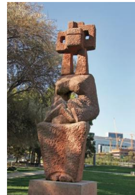
Ilustración 29 Pachamama

(Lugar: Obra Pachamama) Esta es la primer obra de todo el parque, diseñada en piedra roja y cantera de Polpaico por la destacada escultora chilena Marta Colvin, premio nacional de arte en 1970, esta escultura representa a la madre tierra que en su vientre sostiene la cordillera de los Andes.