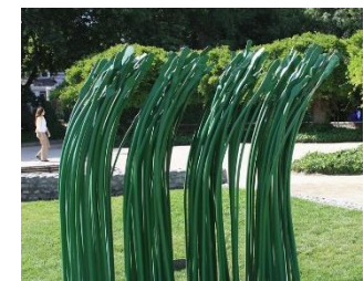
Ilustración 19 Verde y viento

(Lugar: Obra Verde y viento y Obra Libre albedrío) Esta obra titulada Verde y viento de Osvaldo Peña, fue diseñado en barras de hierro pintado y representa el pasto ondeando al viento.