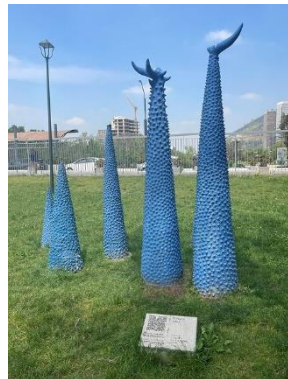
Ilustración 15 Pehuén