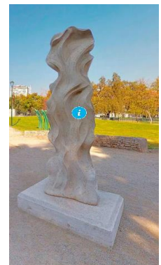
Ilustración 7 Memorias del agua

(Lugar: Obra Memorias del agua) esta escultura de Vincent Beufils llamada Memorias del agua diseñada en mármol representa un tributo al agua como actor principal de la integración en la naturaleza.