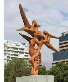
Ilustración 20 Oda al aire

(Lugar: Obra oda al aire) esta escultura titulada Oda al aire de Ignacio Bahna está diseñada en madera de acacia y platanero español representando el viento en su estado más fugaz.