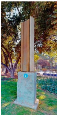
Ilustración 10 Vigas verticales

(Lugar: Obra Vigas verticales) Esta obra de cemento y aluminio llamada Vigas verticales diseñada por el arquitecto y escultor Claudio Girola representa la contraposición del sentido lógico de las vigas horizontales.