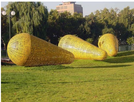
Ilustración 22 Semillas

Muchas de las obras tienen temáticas similares, relacionadas con la naturaleza y la ciudad, el río también es un símbolo que se ve representado en muchas de las obras expuestas en el Parque, ¿Qué otras temáticas observan en las esculturas?