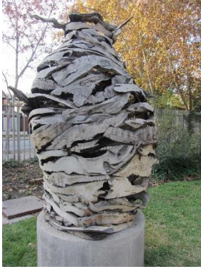
Ilustración 33 Danza espiral

(Lugar: Obra Danza espiral) En esta obra de Pilar Ovalle diseñada en madera de diferentes tipos representando una danza de texturas y formas en espiral que simbolizan lo sagrado y lo terrenal, permitiendo que el material se vuelva misterioso estableciendo los vínculos ancestrales de la madera, de ahí su nombre Danza espiral.