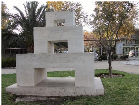
Ilustración 2 Imagen para el Bicentenario

Assler y siendo el primero y único en Latinoamérica hasta el año 2005, transformándose en un proyecto de apoyo permanente al arte y valioso aporte cultural. Actualmente el parque cuenta con más de 40 esculturas diseñadas por destacados artistas chilenos que veremos en el recorrido. A continuación, nos dirigiremos al primer lugar de nuestro recorrido que será la escultura de Lilly Garafulic por la derecha.