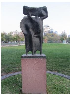
Ilustración 3 La pareja

Continuemos el recorrido para ver las siguientes obras