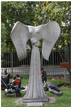
Ilustración 31 Vuelo I

(Lugar: Vuelo I) Esta obra llamada Vuelo I diseñada por Lucía Waiser en hormigón armado representa a una mujer con grandes alas venciendo ataduras para lograr emprender vuelo hacia sus sueños.