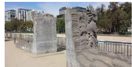
Ilustración 17 Oda al río

(Lugar: Obra Oda al río) Estos conjuntos de esculturas de hormigón fueron diseñados por Federico Assler en forma de homenaje al Río Mapocho, de ahí su nombre: Oda al río.