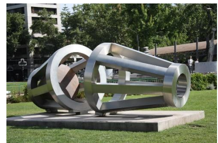
Ilustración 14 Yantra Mandala

(Lugar: Obra Yantra- Mandala) Esta escultura de Aura Castro llamada Yantra Mandala diseñada en acero inoxidable representa símbolos y esquemas budistas geométricos que se utilizan para meditar y tranquilizar la mente.