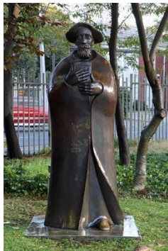
Ilustración 28 Homenaje a Marko Marulic