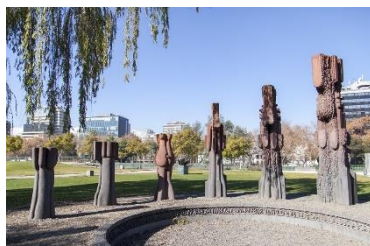
Ilustración 11 Conjunto escultórico

(Lugar: Conjunto escultórico) Estas 6 piezas escultóricas tituladas Conjunto escultórico fueron diseñadas por el Premio Nacional de Artes Visuales del 2009 e impulsor del Parque de las esculturas Federico Assler, observen como el concepto simple del comienzo se densifica en cada escultura hasta la última representando la evolución del ser humano, estas esculturas están diseñadas en hormigón armado, material que este escultor usa en la mayoría de sus obras.