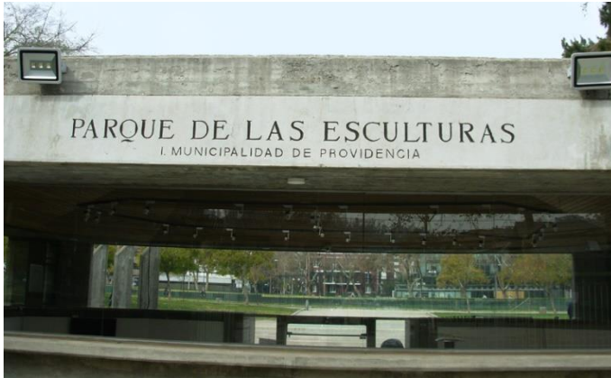
Ilustración 1 Imagen de referencia

(Lugar: Entrada por Av. Santa María – atrás de la sala de exposiciones) Bienvenidos al parque de las esculturas, antes de comenzar el recorrido me gustaría hablarles un poco de la historia de este Parque. En invierno de 1982, un fuerte temporal provocó que el caudal del Río Mapocho aumentara inundando viviendas, avenidas, plazas y los jardines que se encontraban en este lugar, destruyendo todo a su paso, a partir de eso se decidió usar el lugar para crear un parque como área de recreación cultural y artística, inaugurándose en diciembre de 1986 gracias al impulso del escultor Federico