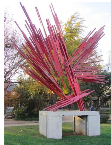
Ilustración 30 Erupción

(Lugar: Erupción) Esta obra llamada Erupción, originalmente titulada Tensión por Sergio Castillo, premio nacional de arte en 1997, fue la segunda escultura en exposición en el parque, diseñada en fierro pintado y puntas de acero inoxidable representa un estallido de fuego simbolizando la actividad volcánica del país y su naturaleza telúrica e imprevisible.