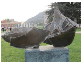
Ilustración 18 Frente a la montaña

(Lugar: Obra Frente a la montaña) Esta obra de Angélica Peric en acero oxidado titulada Frente a la montaña representa una mujer reclinada frente a una montaña.