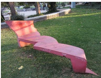
Ilustración 8 Rayo de energía

Desde aquí podemos ver también la obra de acero pintado color rojo de Aura Castro titulada Rayo de energía, que representa un rayo transmisor de energía con forma de banco para recostarse.