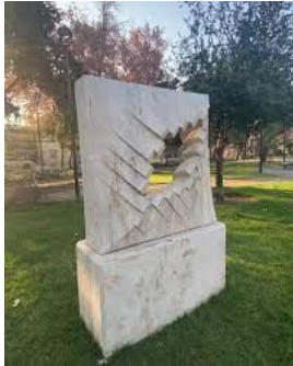
Ilustración 12 Pasaje

(Lugar Obra Pasaje) La obra Pasaje de Simona De Lorenzo fue diseñada en mármol el agujero en la piedra representa un pasaje que al atravesarlo logra el cambio, es decir esta escultura representa la fuerza del cambio.