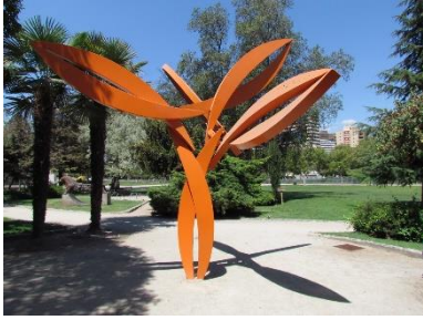
Ilustración 5 Danza de los peces

(Lugar: Obra Danza de peces) Esta obra de Felipe Castillo llamada Danza de peces está diseñada de acero pintado, con esta obra el autor quiso llevar el mar a la ciudad representando múltiples especies marinas y la importancia de cuidarlas.