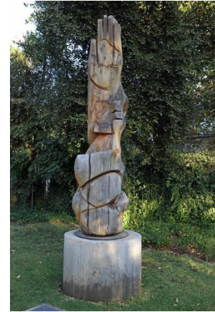
Ilustración 32 Clamor del mar

(Lugar: Obra Danza espiral) En esta obra de Pilar Ovalle diseñada en madera de diferentes tipos representando una danza de texturas y formas en espiral que simbolizan lo sagrado y lo terrenal, permitiendo que el material se vuelva misterioso estableciendo los vínculos ancestrales de la madera, de ahí su nombre Danza espiral.