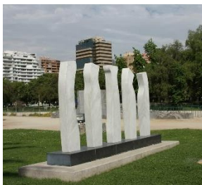
Ilustración 16 Vigías del parque

(Lugar: Obra Vigías del parque) Esta obra de mármol blanco y negro de Cecilia Campos se llama Vigías del parque simbolizando los guardianes de la naturaleza y las obras presentes en el parque.