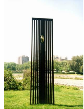
Ilustración 13 La semilla

(Lugar: Obra La semilla) Esta obra titulada la semilla representa la capacidad de renacer a pesar de estar prisionero de los barrotes, esta escultura fue diseñada en acero soldado y oxidado con un centro de bronce fundido y pulido por la escultora Patricia del Canto.