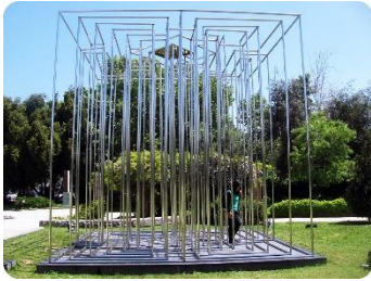
Ilustración 21 Libre albedrio

Aquí también podemos ver la obra Libre albedrio de Alicia Larraín Chaux diseñada en tubos de acero inoxidable representa un laberinto donde el cuerpo humano puede intervenir simbólicamente el espacio.