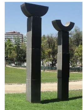
Ilustración 9 Sol y luna

(Lugar: Obra Sol y luna) Esta obra de José Vicente Gajardo titulada Sol y luna está diseñada en Granito negro, blanco y gris y representa la presencia del hombre y la mujer en el universo.