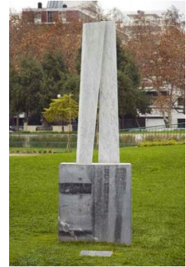
Ilustración 6 Dioses del amanecer

lumínico, representando la llegada de la aurora como momento en el que los dioses del universo hacen que la humanidad vea la luz de un nuevo amanecer.