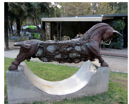
Ilustración 4 Toro Sentado

(Lugar: entre la obra Toro sentado y La pareja) La siguiente obra es de Juan Egenau y se llama La pareja, es de las primeras obras del Parque, está diseñada en bronce y presenta la estrecha interacción ancestral entre el hombre y la mujer por la vida. También aquí nos encontramos la obra Toro sentado de Pablo Valdés, diseñada de piedras del río Mapocho, barro cocido y fierro fundido, simboliza la contradicción del toro como animal salvaje y su función como objeto ya que también simboliza un lugar para sentarse.