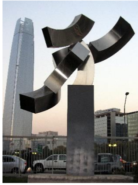
Ilustración 27 Nubes cósmicas

También podemos observar la obra Nubes cósmicas de Cristina Pizarro diseñada en acero inoxidable representando la existencia de una inteligencia ordenadora y sabia que ilumina y se basta a sí misma.