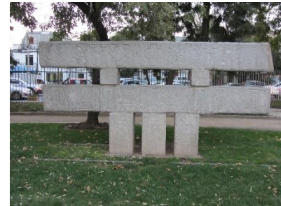
Ilustración 26 Estela monumental

(Lugar: Obra Estela monumental) Esta escultura se llama Estela monumental de Samuel Román, premio nacional de arte (1964) diseñada en granito ala de mosca y cantera del Cajón del Maipo, representa principios base de los seres humanos: bien hombre – vida justicia – cultura humanidad.