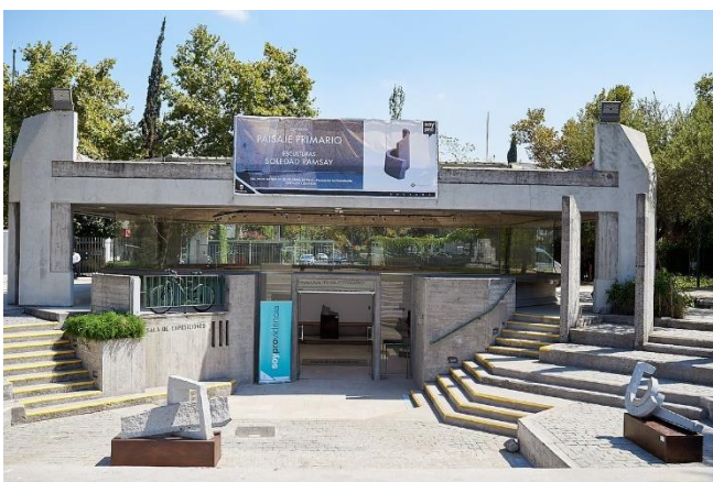
Ilustración 36 Finalización del recorrido

Ahora para finalizar el recorrido entraremos a la sala de exposiciones del parque, este lugar fue inaugurado en 1989 como un complemento del parque para exponer obras de mediano y pequeño formato.