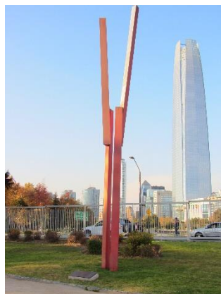
Ilustración 24 Aire y luz

(Lugar: Obra Aire y luz) esta obra fue una de las primeras en el parque, se llama Aire y luz diseñada por Carlos Ortúzar en fierro y acero inoxidable es una escultura cinética que representa dos brazos enfrentados al viento.