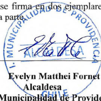
Evelyn Matthei Fornet Alcaldesa