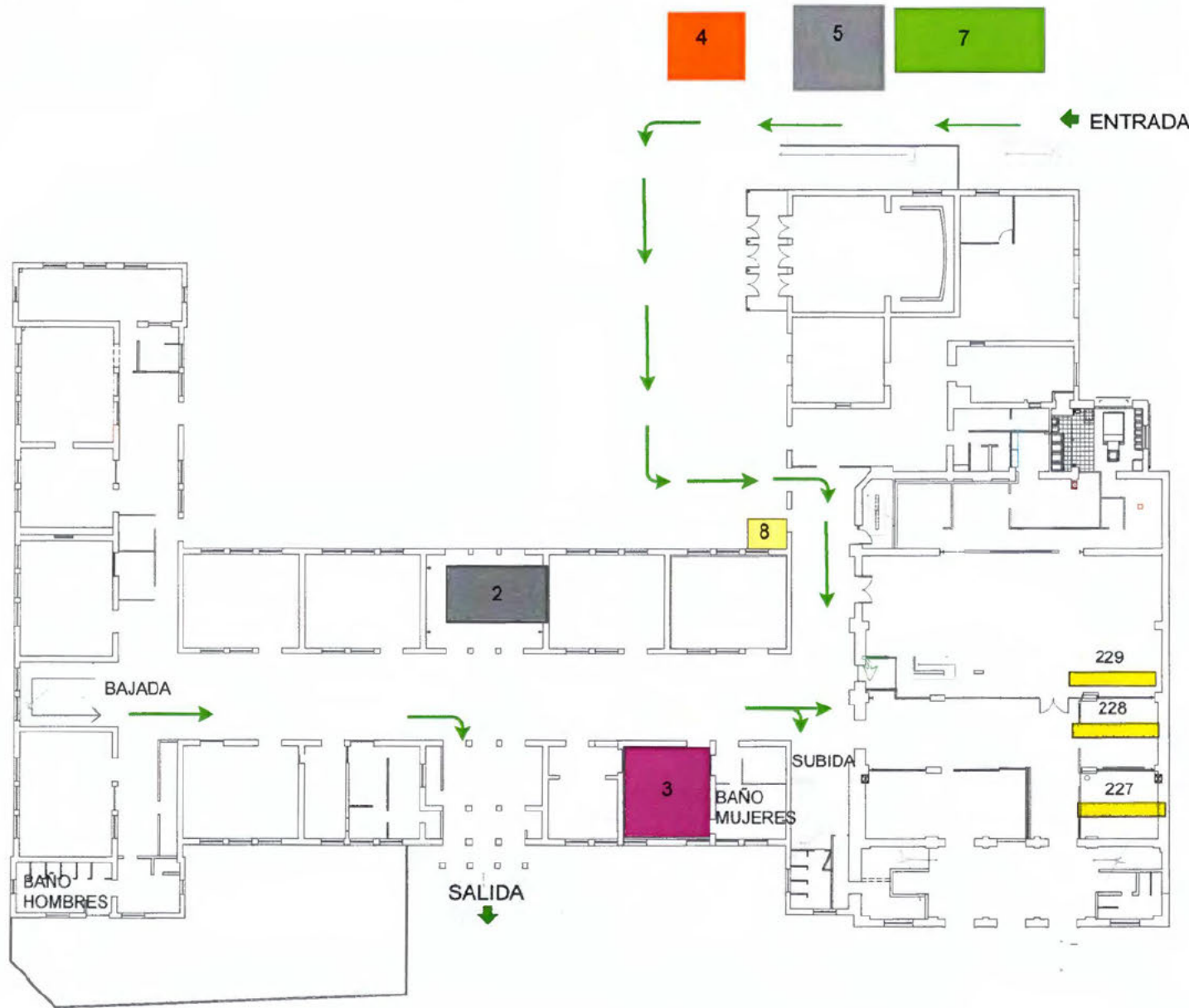
PLANTA 1° PISO