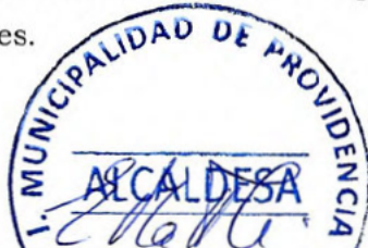
EVELYN MATTHEI FORNET Alcaldesa Municipalidad de Providencia