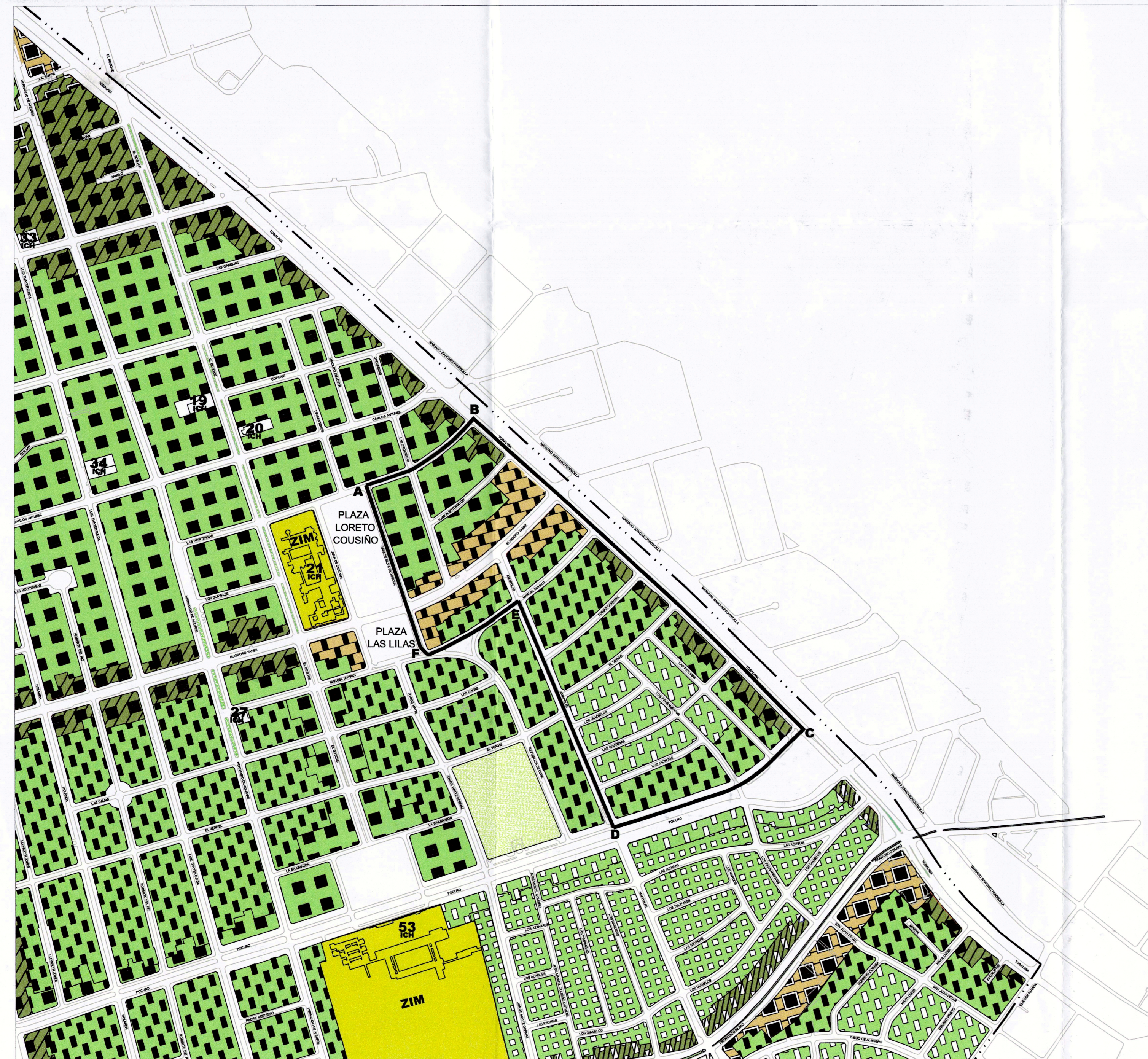
SITUACION ANTERIOR PLAN REGULADOR PRCP 2007 PLANO DE EDIFICACION BARRIO LAS LILAS - NORTE DE POCURO ESCALA 1:5.000